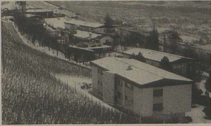
Une vue de Saint-Raphaël.

CHAMPLAN (gé). - Cette année, l'institut Saint-Raphaël fête ses 35 ans d'activité au service des jeunes. L'évolution a été marquante, soit au niveau des constructions, soit au niveau du développement et de la qualité des prestations proposées dans le domaine pédagogique.