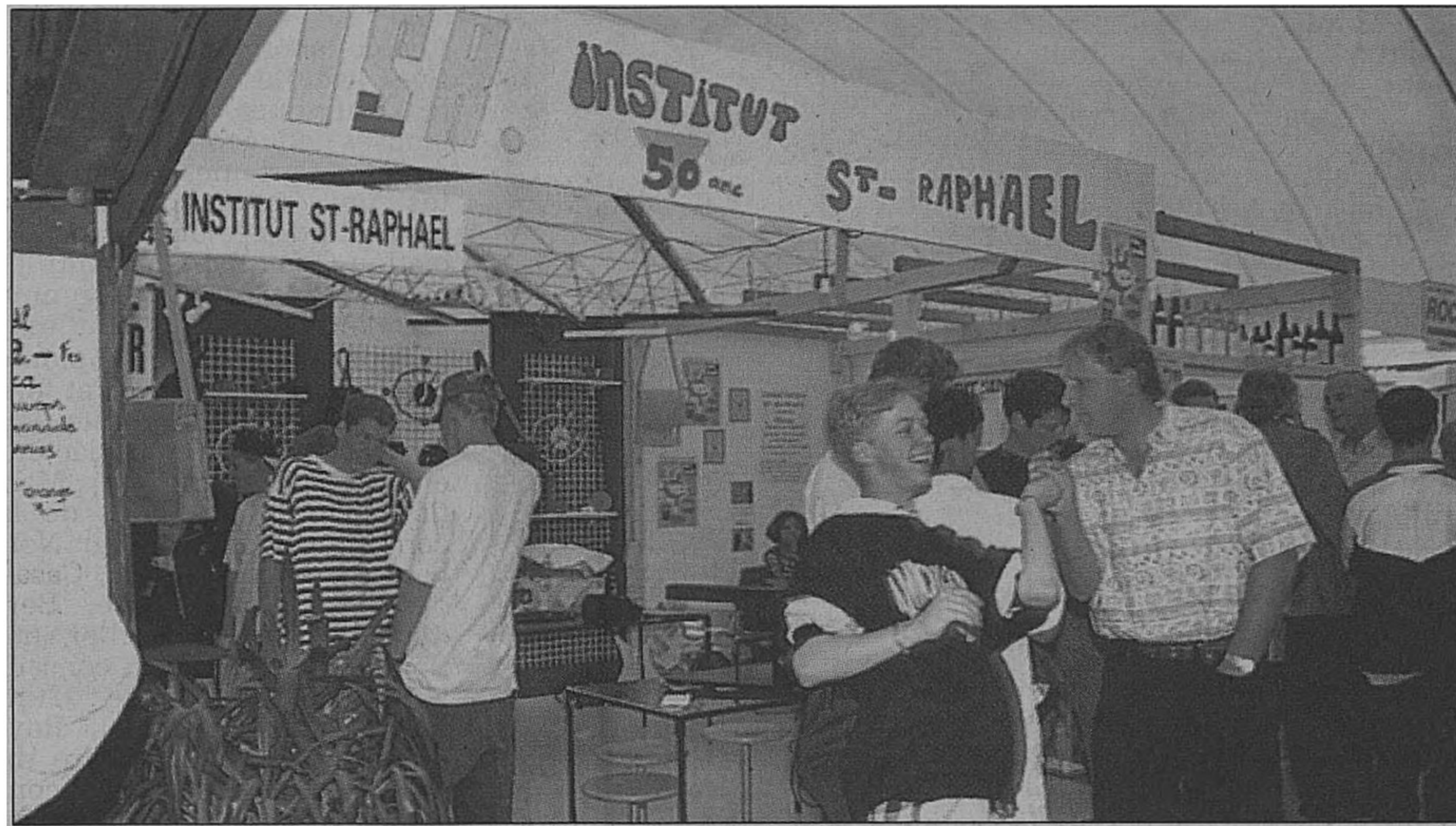
Le stand de Saint-Raphaël: un exemple d'enthousiasme et de rigueur.

L'institut compte de nombreuses cordes à son arc avec par exemple un Atelier-Boutique en ville de Sion, qui permet aux jeunes de se familiariser avec le milieu économique de manière tout à fait concrète, s'impliquant active-